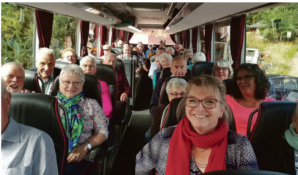
Course de paroisse, la présidente en tête!

La fête de l'offrande sera l'occasion de valoriser le temps de l'offrande, de vivre ensemble l'ouverture du KT ainsi que de découvrir l'exposition du concours d'illustrations (adressé aux classes de 1 à 6P) sur le thème « Les oiseaux s'envolent ». Toutes les œuvres des enfants seront exposées. Nous nous réjouissons de découvrir le coup de plume (de crayon ou de pinceau) de nos jeunes artistes.