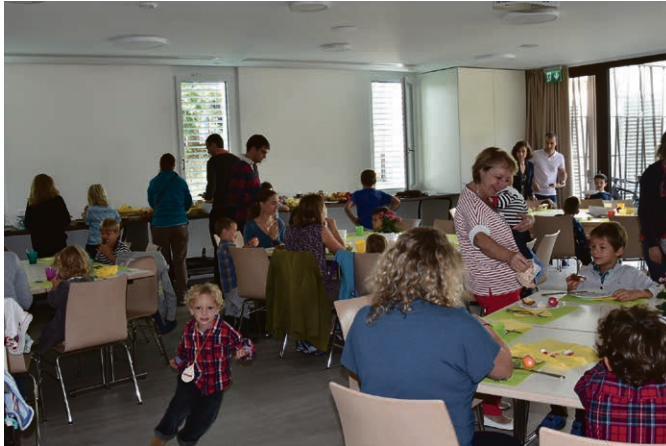
Ambiance chaleureuse au brunch des familles.

le Cep à Rolle. Inscription auprès d'Annie Curchod, 021 825 25 58.