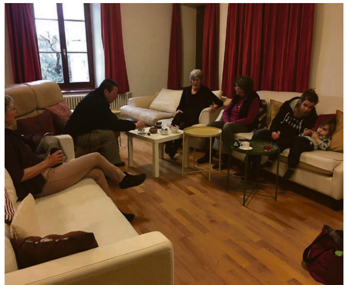
Un moment de détente et de partage.