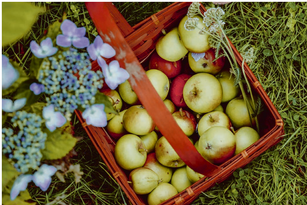
Terre Sainte - Céligny:Reconnaisants pour les dons de Dieu.

Rencontre jeudi 7 novembre, à 20h , à Commugny, salle de paroisse, et jeudi 28 novembre chez D et F. Gehring, ch de la Dauphine 52 à Commugny.