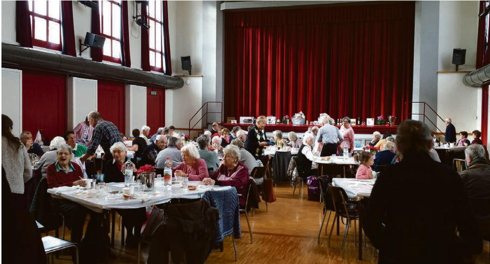
Bazar in Nyon 2018.