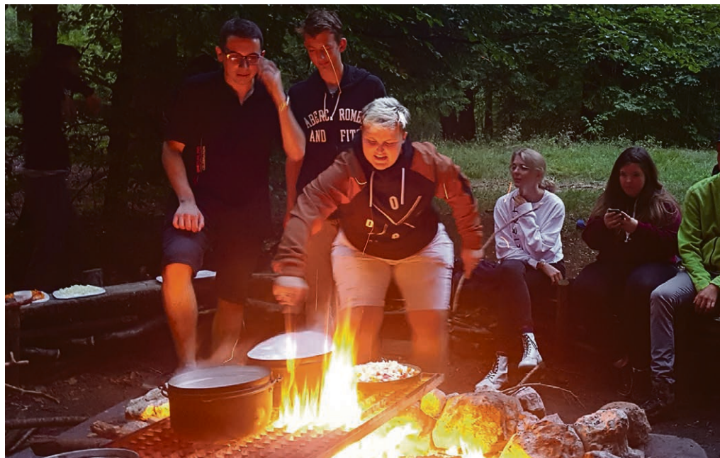
La cuisine au feu de bois, tout un art!