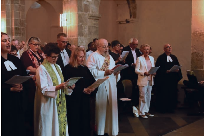
Magnifique célébration œcuménique à l'abbaye de Bonmont, lors du jeûne fédéral.

que divers travaux de rénovation au temple de Crassier.