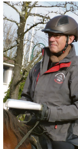
En marche vers l'Avent.

Dimanche 24 novembre , le groupe de jeunes invite les anciens membres du groupe Dé->part à venir fêter ses 33 ans. À cette occasion, venez les entourer dans une ambiance de détente et de partage. Culte à 10h30, repas canadien à la salle paroissiale et animations. Inscription sur www.saralain.info/33ans ou auprès des pasteurs. Pour plus d'informations, le 077 481 77 36.