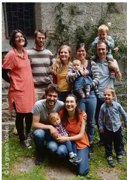
Inventer de nouvelles manières d'habiter où communauté, spiritualité et vie active se nourrissent l'une l'autre: le défi de La grande tablée.

Le 7 septembre, une jeune communauté fête son installation sur le domaine de la Grant Part. Une étape importante pour ce collectif de chrétien·nes.