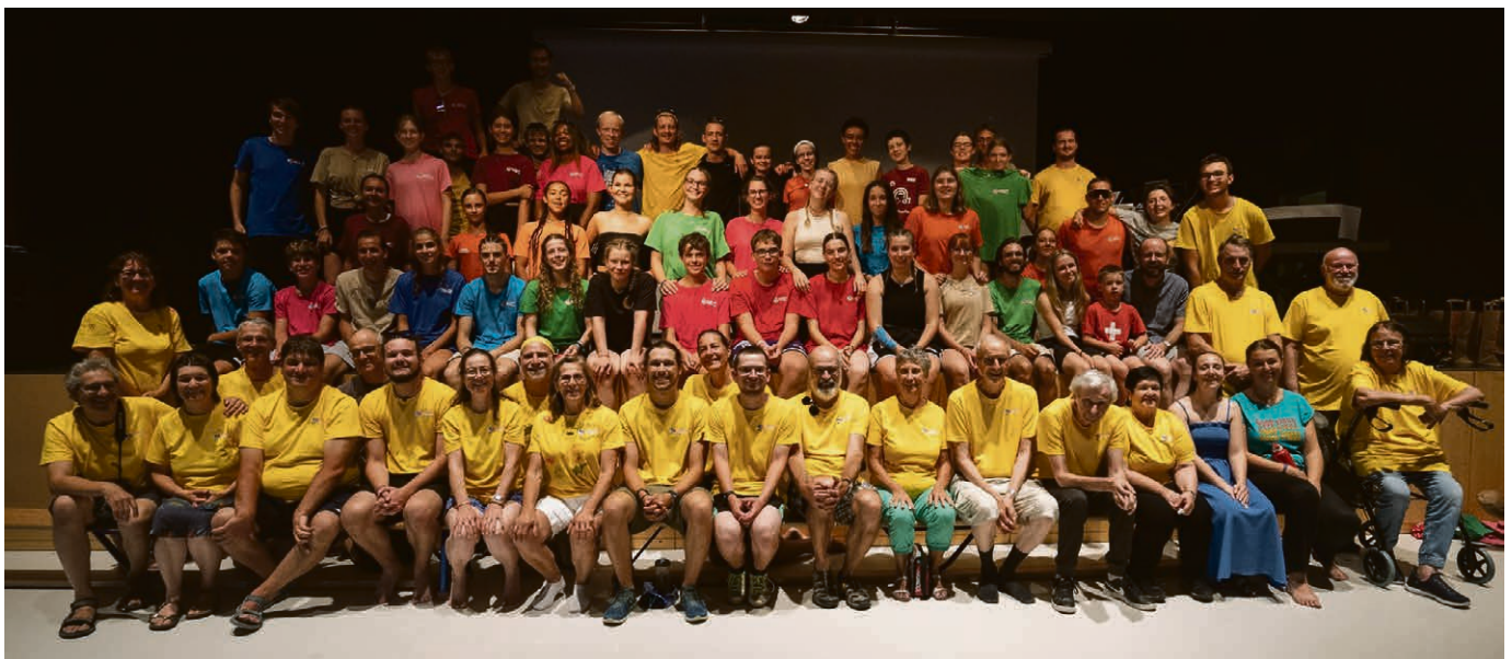
L'équipe d'encadrement (coachs, aide-coachs, arbitres et staff) d'Apples et Lonay, les 2 sites régionaux des derniers Kids Games. Du 4 au 9 août, 160 enfants et jeunes adolescents ont participé à ces olympiades solidaires et festives.

PRIÈRE AVEC LES CHANTS DE TAIZÉ Dimanche 8 septembre, 19h30 , temple de Lonay. ▴