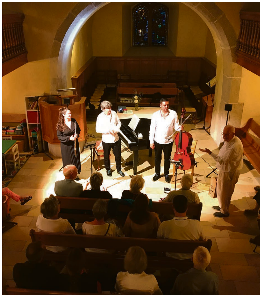
Concert estival du 21 juillet.