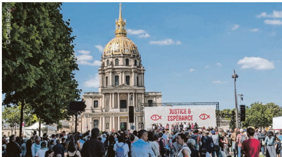
Rassemblement œcuménique du 23 juin.