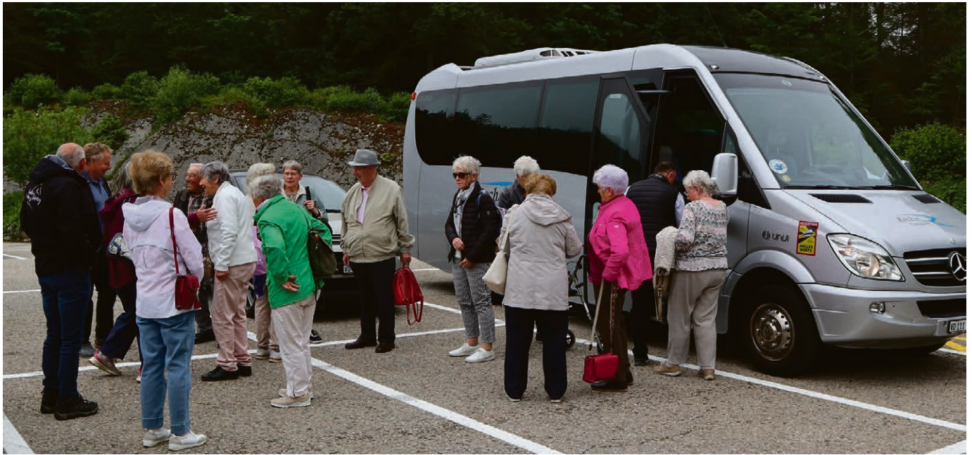
Ausflug der Kirchgemeinde Morges-La Côte-Nyon.

tème lors des Rameaux. Informations et inscription sur le site régional Morges-Aubonne: eerv.ch/morges-aubonne .