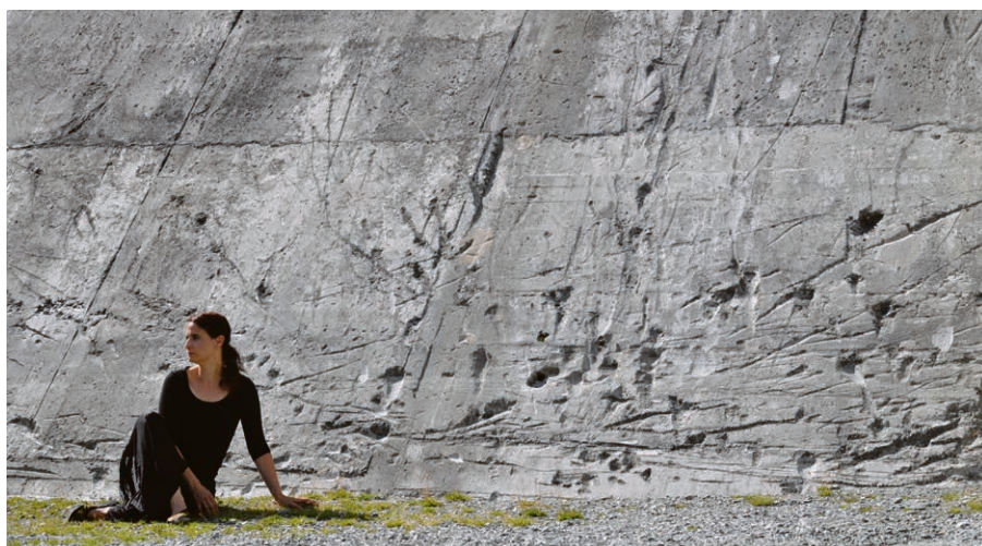
Le film Dignity : de l'Ombre à la lumière (2024) interroge les violences sexuelles notamment en milieu chrétien.