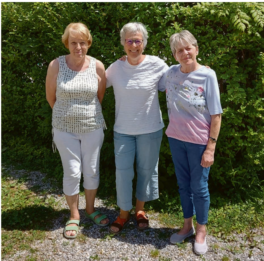
L'équipe du Service Ecoute - Présence - Solidarités.

Informations détaillées et inscriptions: renaud.rindlisbacher@cerv.ch - www.aurendezvousdelanature.com . ▲