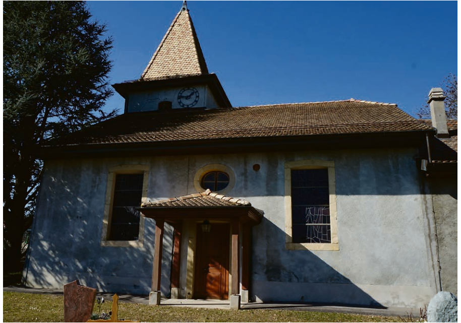
Dès ce mois de septembre, nous nous réjouissons de retrouver le temple de Bussy pour des cultes et des Espace Souffle.

Dimanche 22 septembre, 10h , temple de Bussy. A la suite du récent refus par le conseil communal de Hautemorges