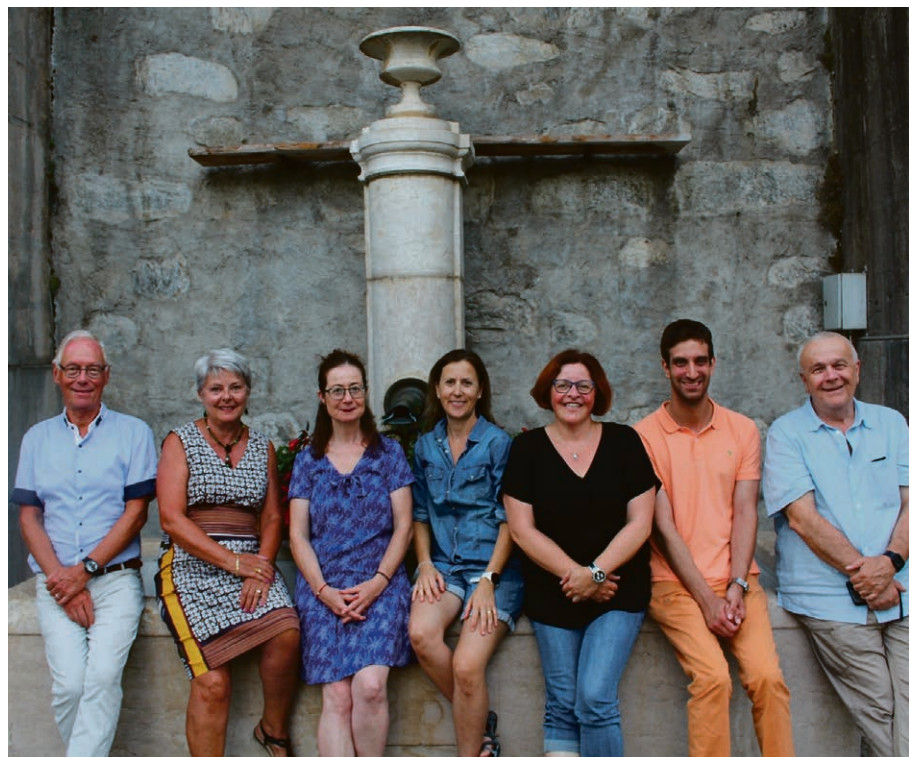
Le nouveau conseil paroissial de l'Aubonne pour 2024-2029 (cf. encadré).