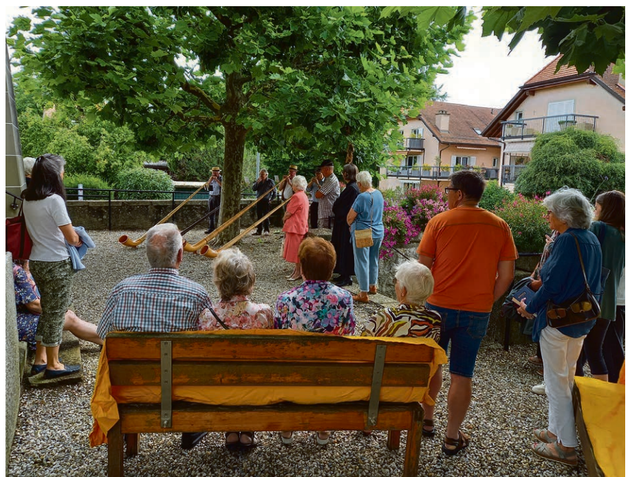
Culte Tandem à Vufflens avec les cors des Alpes.