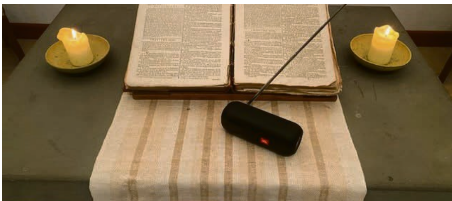
La Parole sur les ondes!