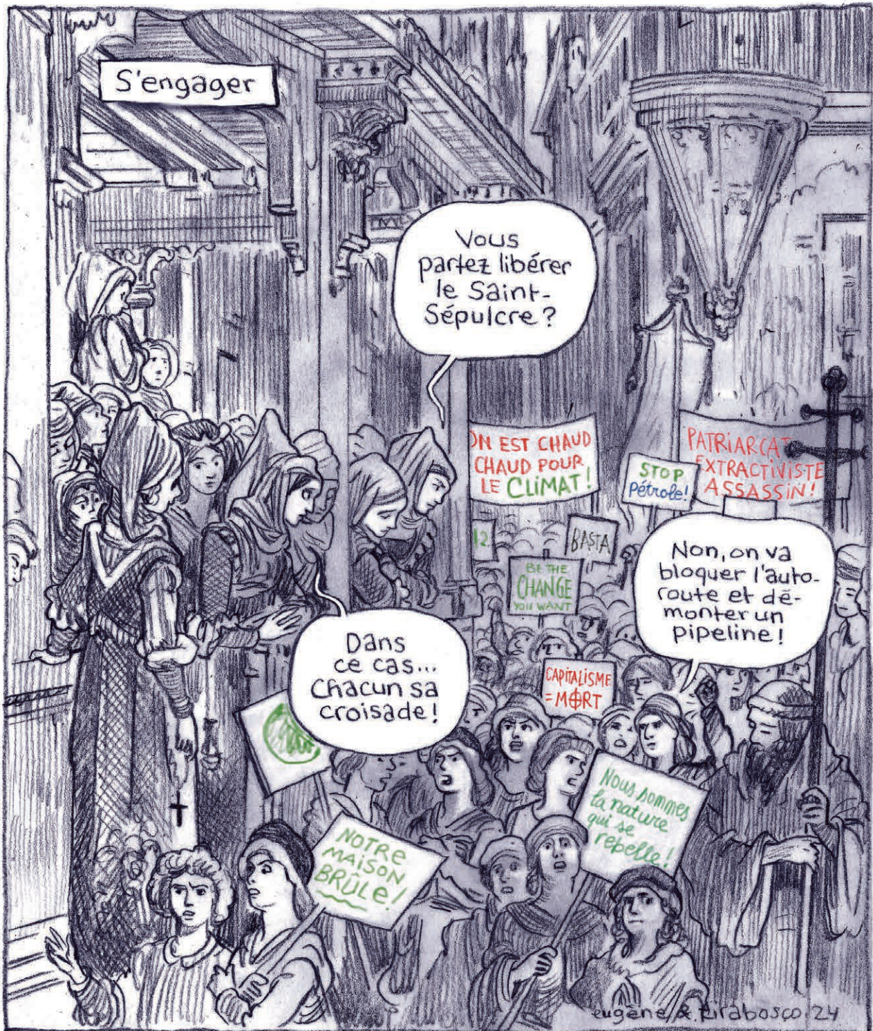
D'après «La Croisade des enfants» de Gustave Doré, 1877