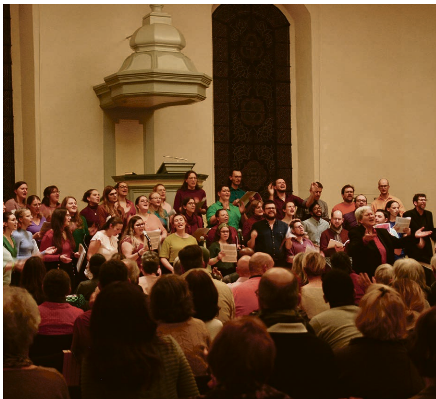
Concert de 2023.

Le ciel de la fin d'année ressemble souvent à notre monde : gris sombre, voire noir, pluvieux et agité de bourrasques glaçantes. Il est difficile de garder un espoir allumé dans cette météo. Et pourtant, nul ne peut vivre sans cette flamme projetée sur l'avenir. Le 1 er dimanche de l'Avent, nous allumerons un feu pour dire notre volonté de croire et d'espérer en un monde meilleur. Un espoir ancré en Dieu, suspendu à la naissance de son enfant sur notre terre. Venez partager un moment d'espoir et de convivialité! Dimanche 1 er décembre, 17h45 , derrière l'église de Vufflens.