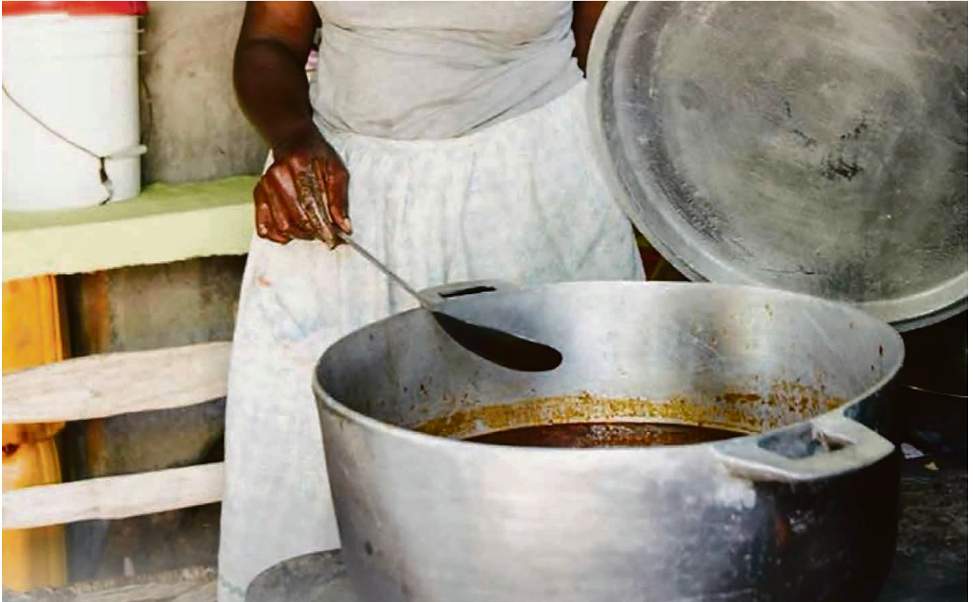
«Ecrasons les figues et appliquons-les sur les plaies»: extrait du message du Jeûne fédéral au culte inter-paroisses Veyron-Venoge et La Sarraz à Moiry.