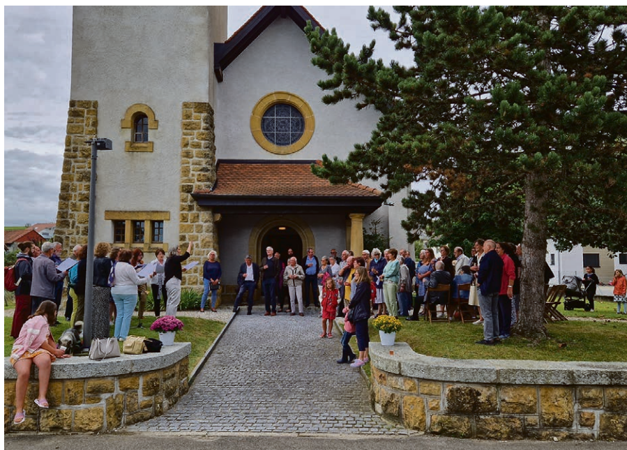
Le chœur de l'église catholique de Poliez-Pittet.

4 et 18 novembre : Spagh'à tout de 11h45-13h30 , à la salle de paroisse d'Echallens (inscription souhaitée). 13 novembre : repas à la grande salle de Bioley-Orjulaz, de 11h45-13h30 (inscription souhaitée). 26 novembre : repas à la grande salle de Poliez-le-Grand, de 11h45-13h30 (inscription souhaitée). Contact: Quentin Wenger, 079 611 12 57.