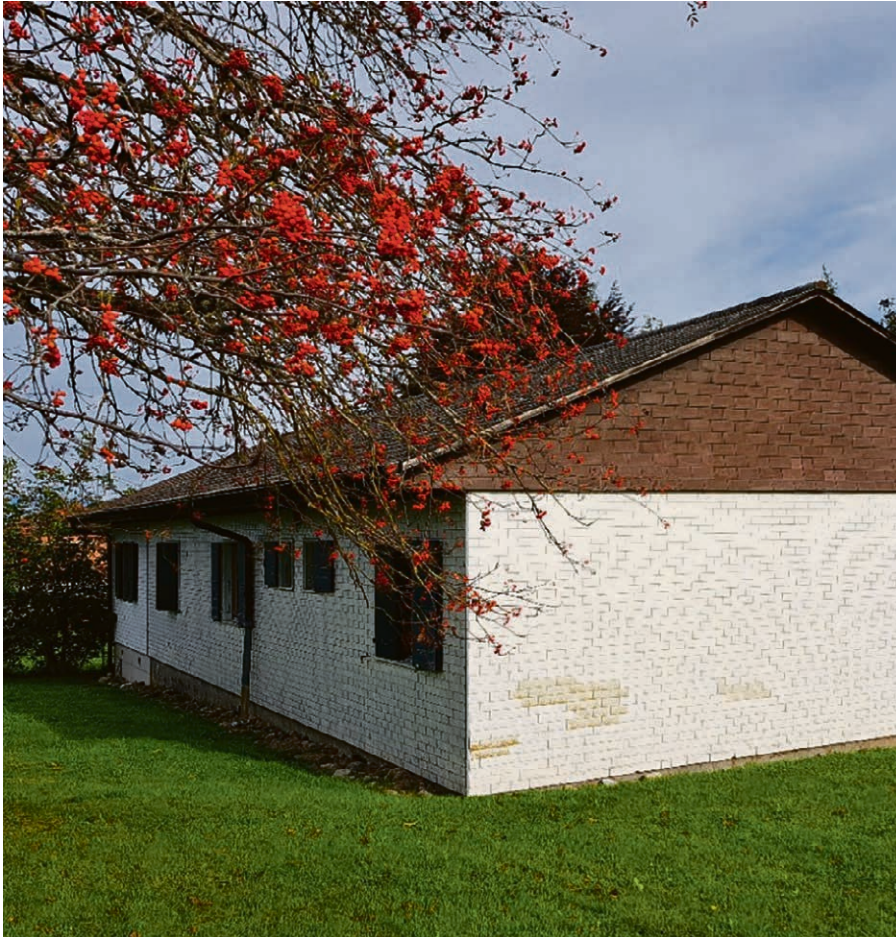
La salle de paroisse dont il faudrait changer les fenêtres pour plus de confort.

rivée des cavaliers porteurs du message de Crêt-Bérard et un apéritif offert par la commune.