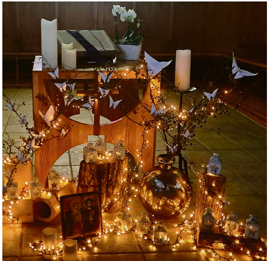
Eglise de Penthalaz – Semaine « Lumières du souvenir » 2023.

COSSONAY – GRANCY Le dimanche 26 novembre, nous prendrons le temps de nous souvenir des personnes de la paroisse qui nous ont quittées dans l'année, ou simplement celles dont le deuil nous traverse encore aujourd'hui. Le culte du souvenir est l'occasion pour les proches des défunt-es de leur rendre hommage, soutenus en cela par l'espérance en notre Seigneur. Venez vivre ce temps précieux et offrir le réconfort de la communauté aux personnes endeuillées.