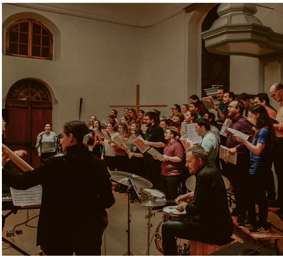
Concert WeGo de 2023.

Dans notre région, plusieurs concerts de gospel auront lieu entre novembre et décembre. L'occasion de revenir sur l'origine et le sens spirituel que l'on peut trouver derrière ces chants entraînants.